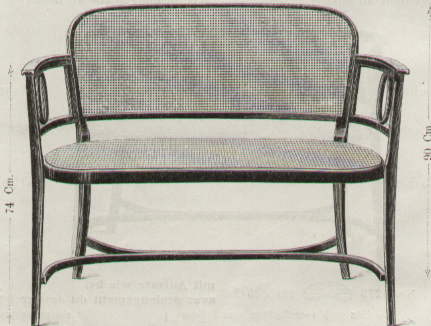
Kanapee } Nr. 6278 103 x 45 Cm. Canapé }

Erzeugende Fabrik: Koritschan. Bruttogewicht in Stroh 9 Kg.