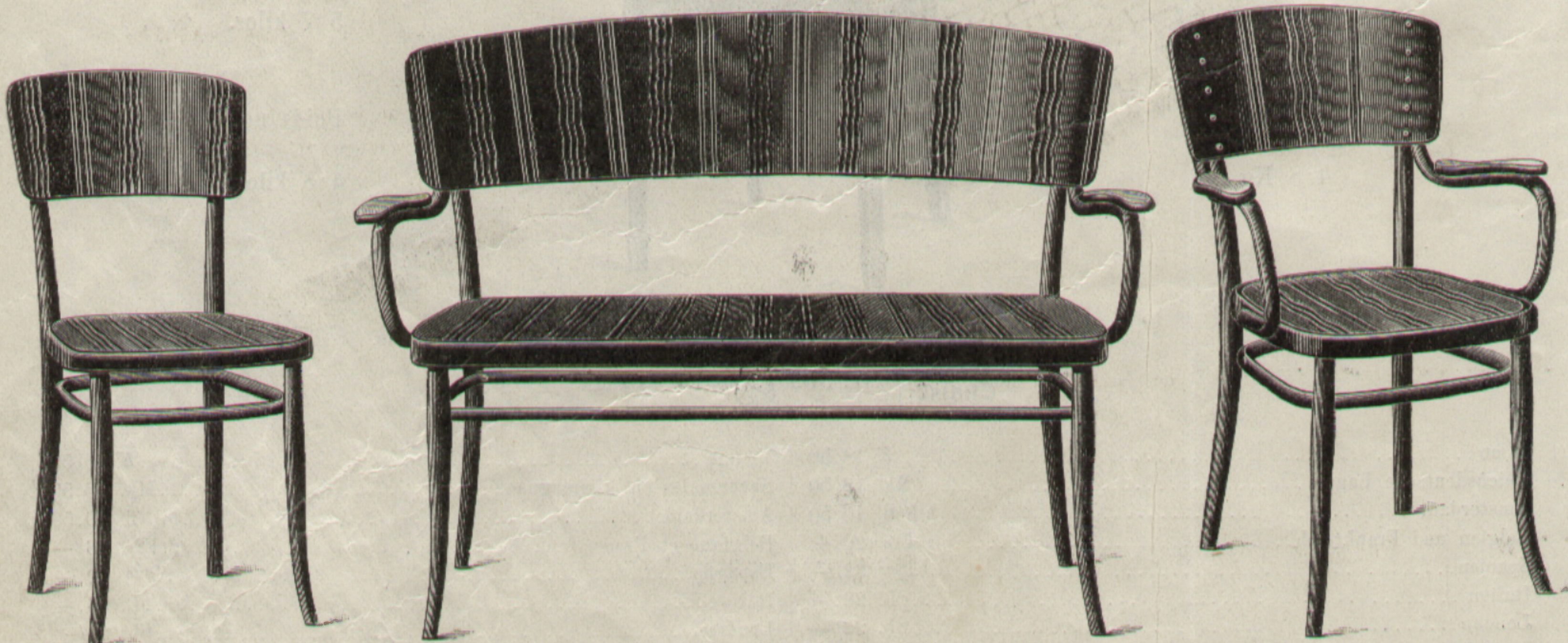
Ansicht der Garnitur Nr. 57 mit Wellendessin. — Preis derselben wie Relief. Vue du mobilier No. 57 avec sièges et dossiers ondulés, même prix qu'en relief.