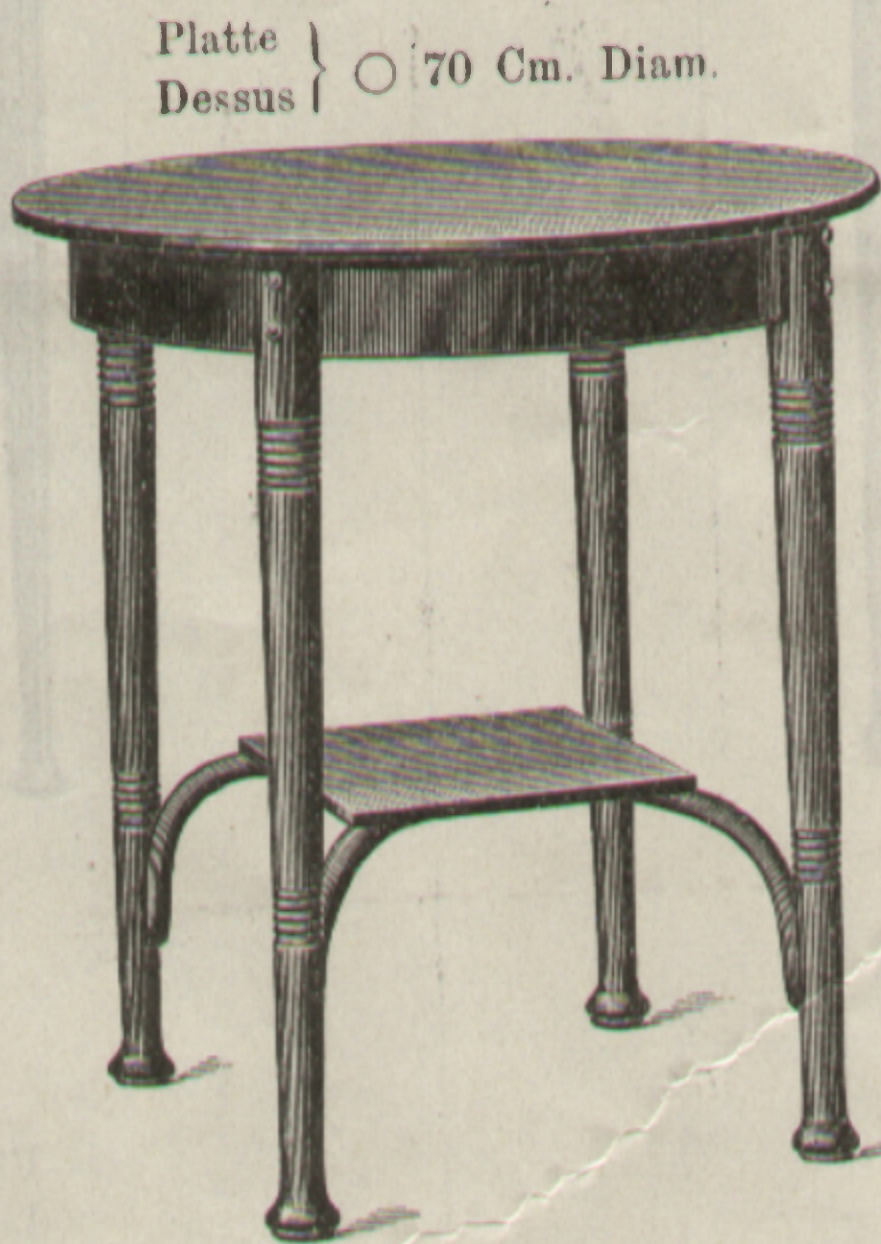
Tisch Table } Nr. 8170

Normal-Ausführung: ohne Steg, Gestell poliert, Platte aus Fournierbretteln, lackiert.