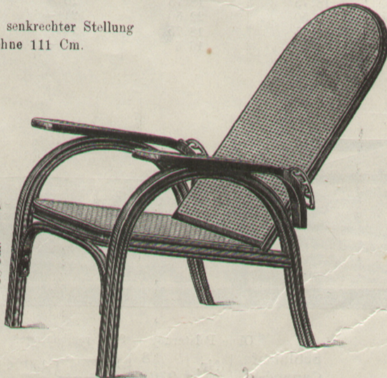
Morris-Fauteuil Fauteuil „Morris“ } Nr. 6393 48 × 51 Cm.