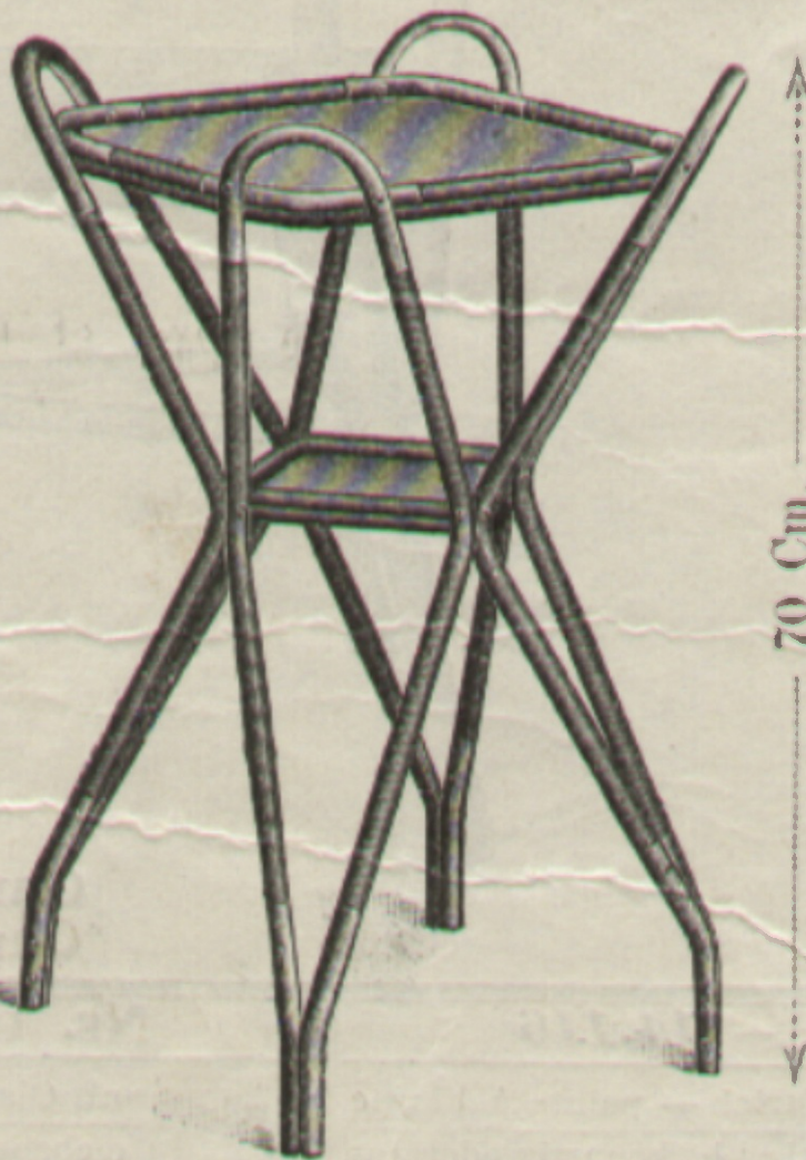
Tischchen } Nr. { 261 Petit table } Nr. { 9261