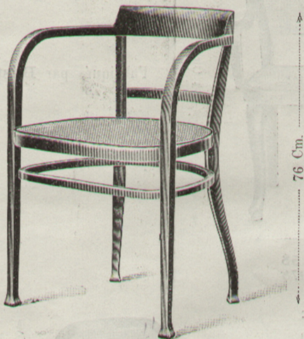
Fauteuil Nr. 6523 47 × 43 Cm.

Nettogewicht 4·3 Kg. — Poids net 4·3 kilos.