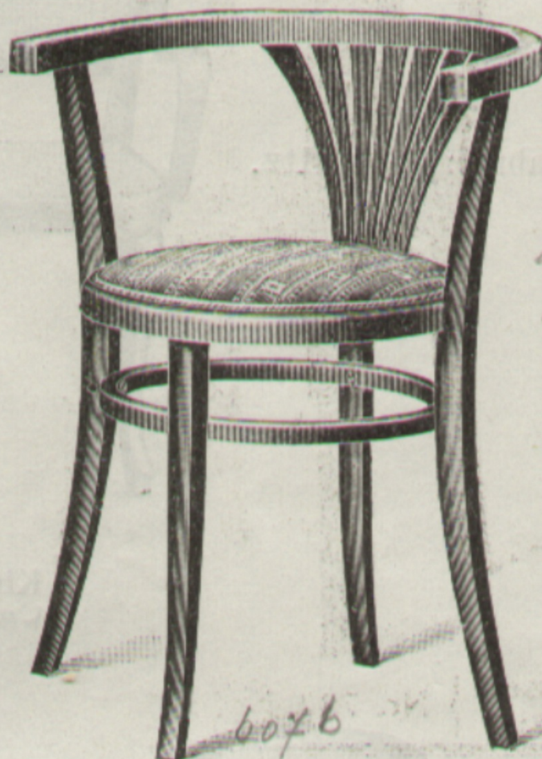
Schreibfauteuil } 28 Fauteuil de bureau Nr. 6027 Profil 42 Cm. Durchm.

Nettogewicht 3·8 Kg. — Poids net 3·8 kilos.