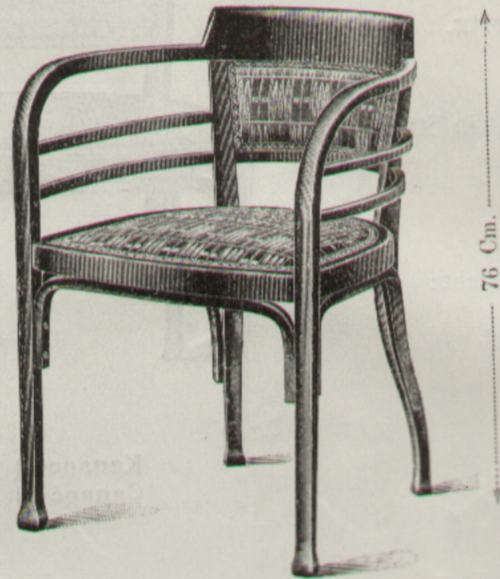
Sessel Chaise } Nr. 754 G ⊗ 40 × 42 Cm.