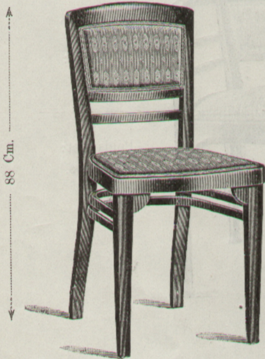
Sessel } Chaise } Nr. 755 G ☒ 43 × 41 Cm.

Erzeugende Fabrik: } Fabriqués par } Bystritz.