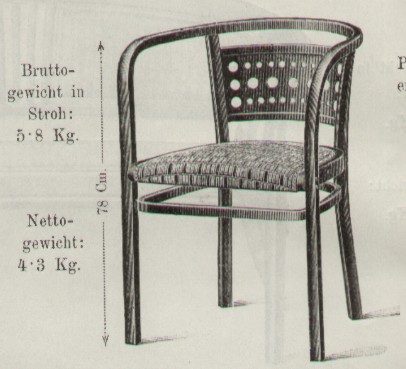
Sessel Chaise } Nr. 756 G ☒ 40 × 42 Cm.

Bruttogewicht in Stroh: 5.8 Kg. Nettogewicht: 4.3 Kg. 78 Cm.