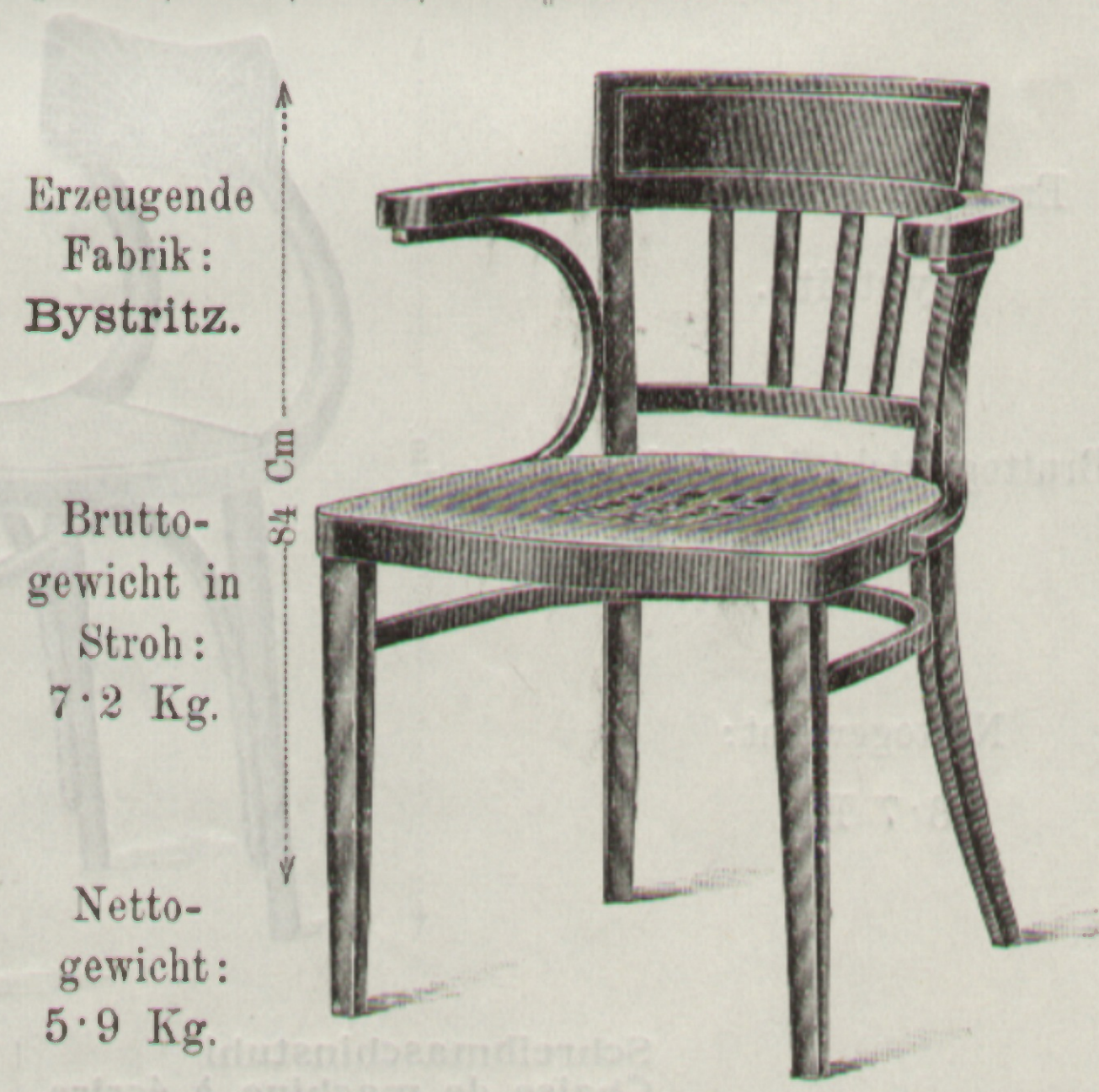
Sessel Chaise } Nr. 549 43 x 41 Cm.