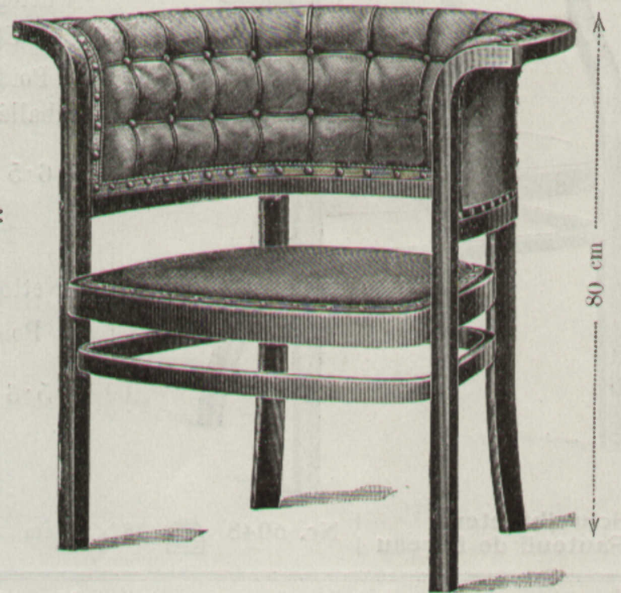
Fauteuil Nr. 6534 58 × 59 cm