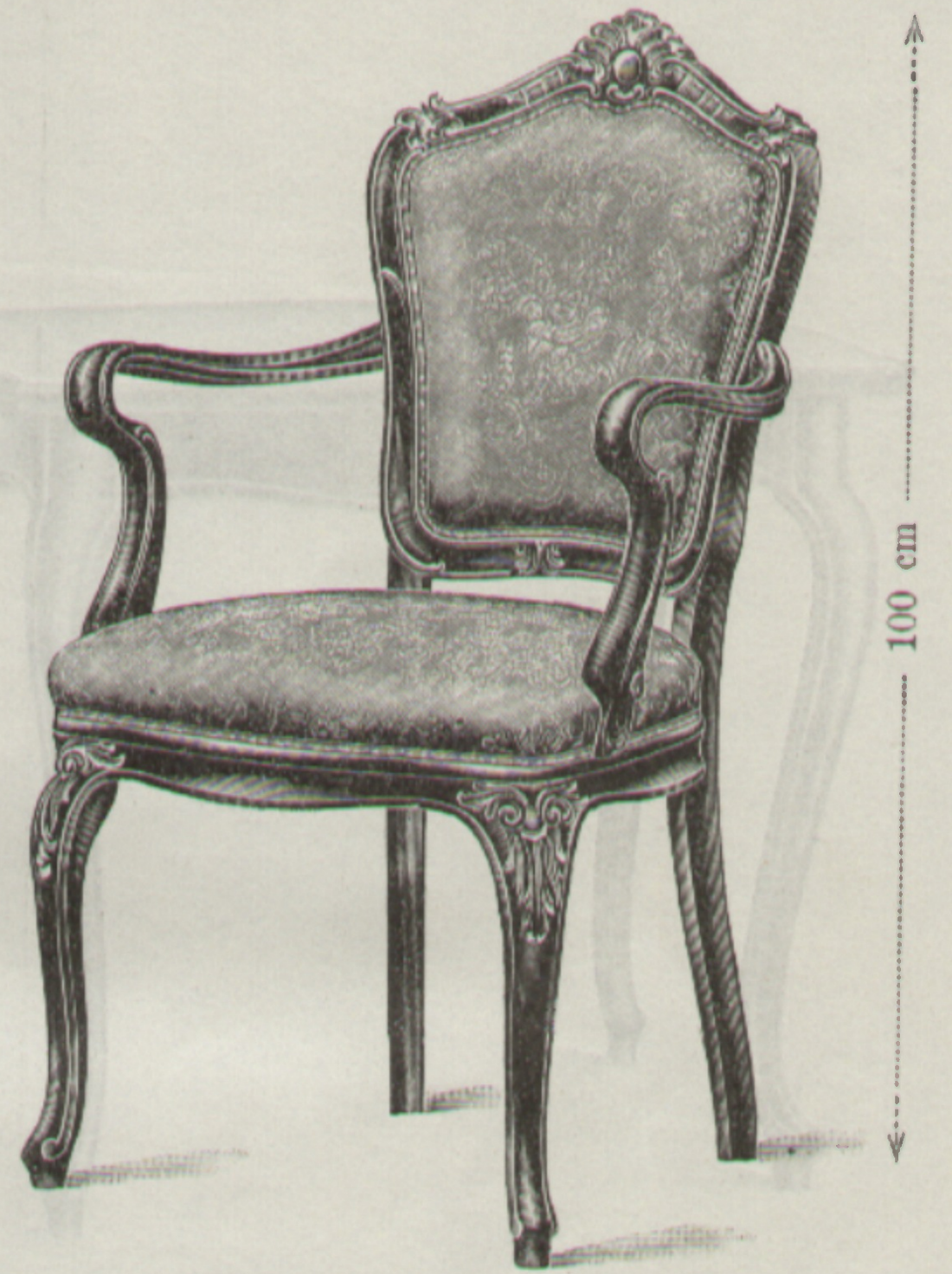
Nr. 1604, Fauteuil 49 × 53 cm