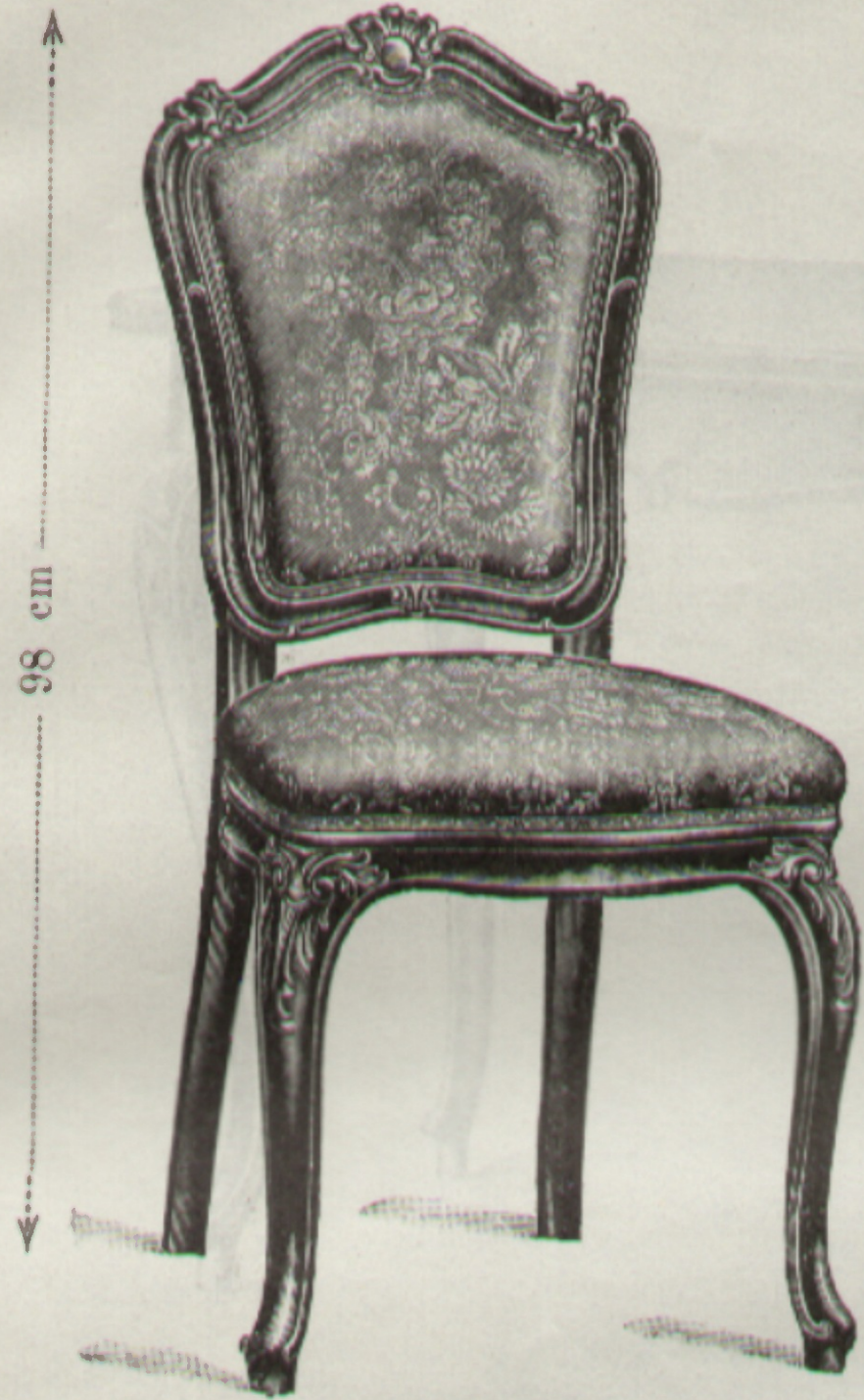
Nr. 604 { Sessel Chaise } 44 × 44 cm

Erzeugende Fabrik: } Fabriqués par } Bystritz.