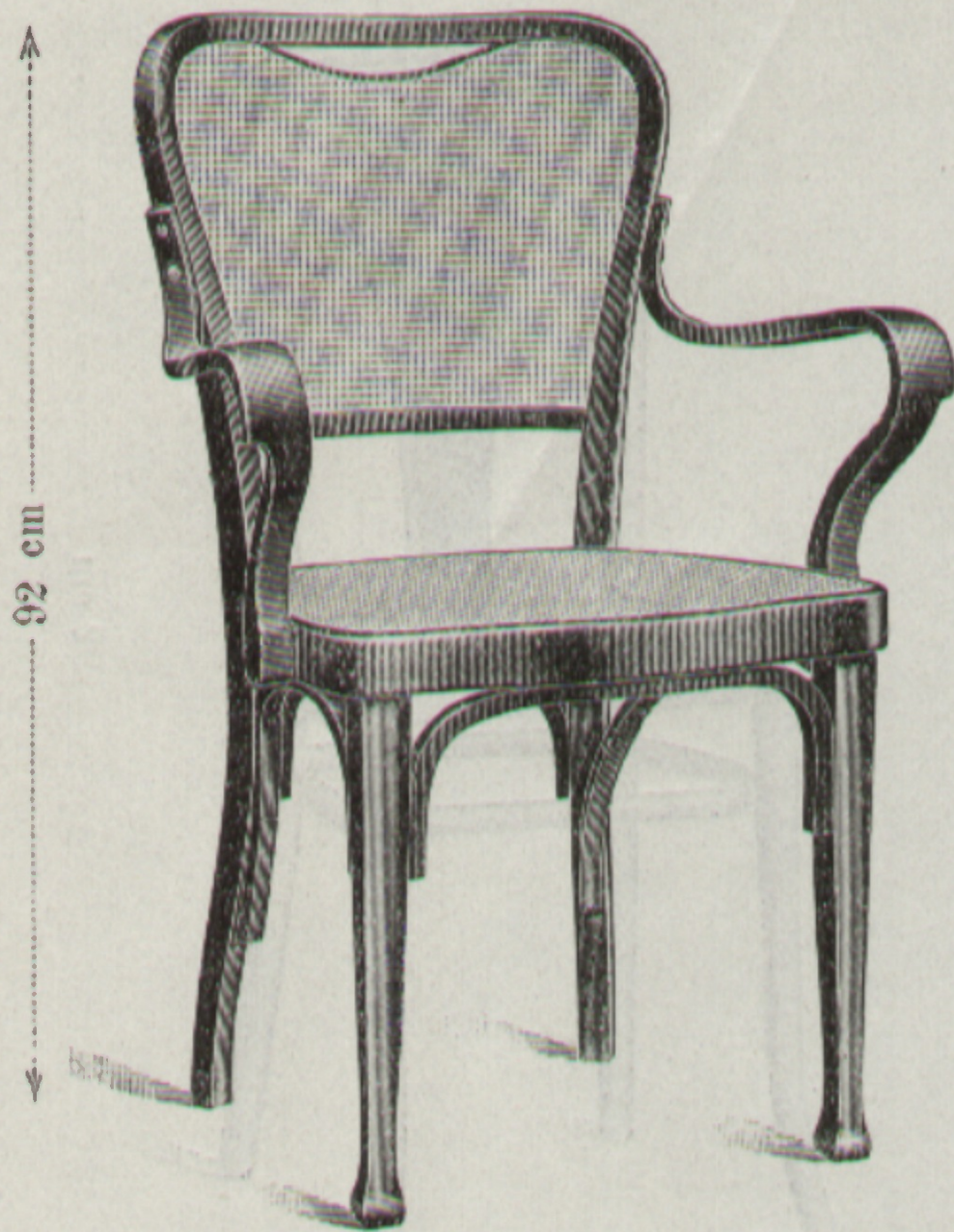
Nr. 1419, Fauteuil 48 × 50 cm

Erzeugende Fabrik: } Fabriqués par } Bystritz.