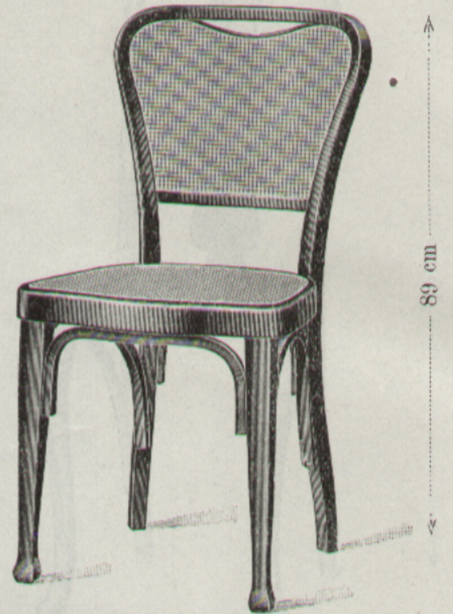
Nr. 419 { Sessel 44 × 44 cm

Nettogewicht: Poids net: 4·4 { Kg. kilos.