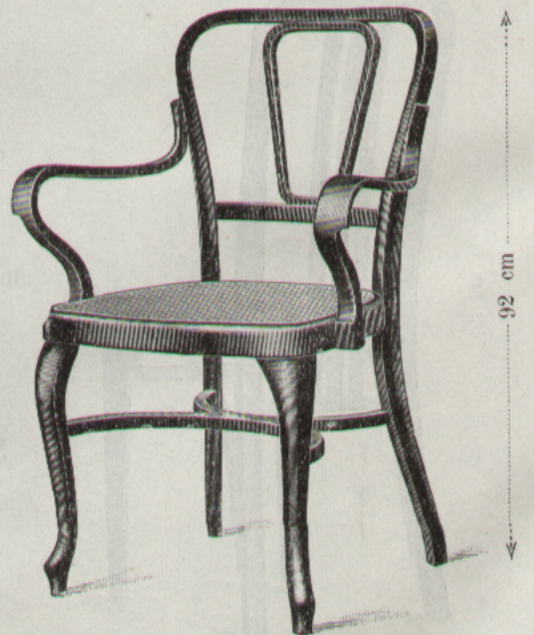
Nr. 1418, Fauteuil 48 × 50 cm