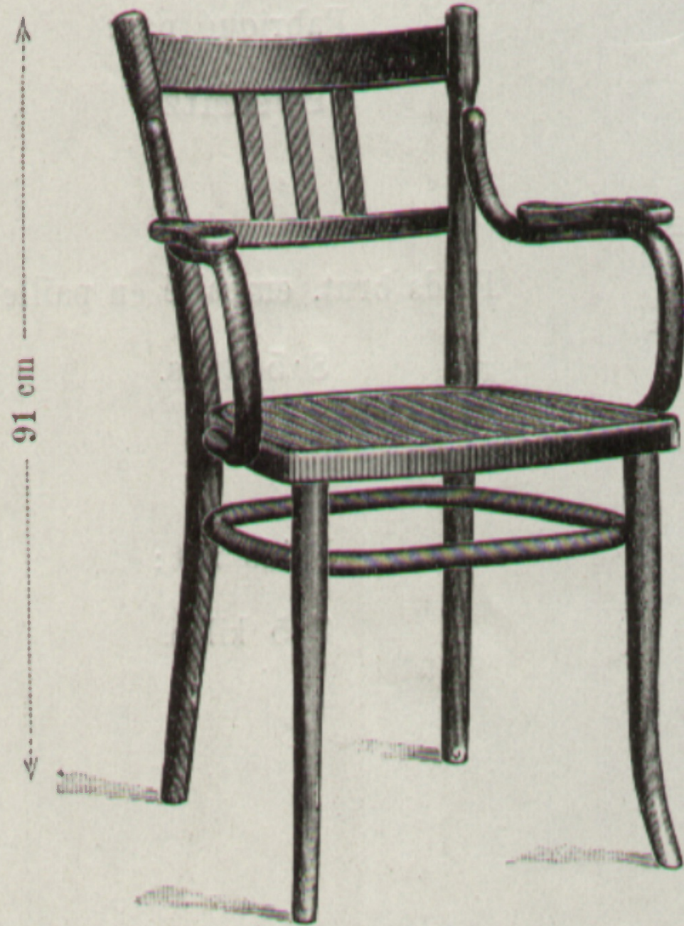
Nr. 1251, Fauteuil R 46 × 45 cm

Erzeugende Fabrik: Fabriqué par Koritschan.