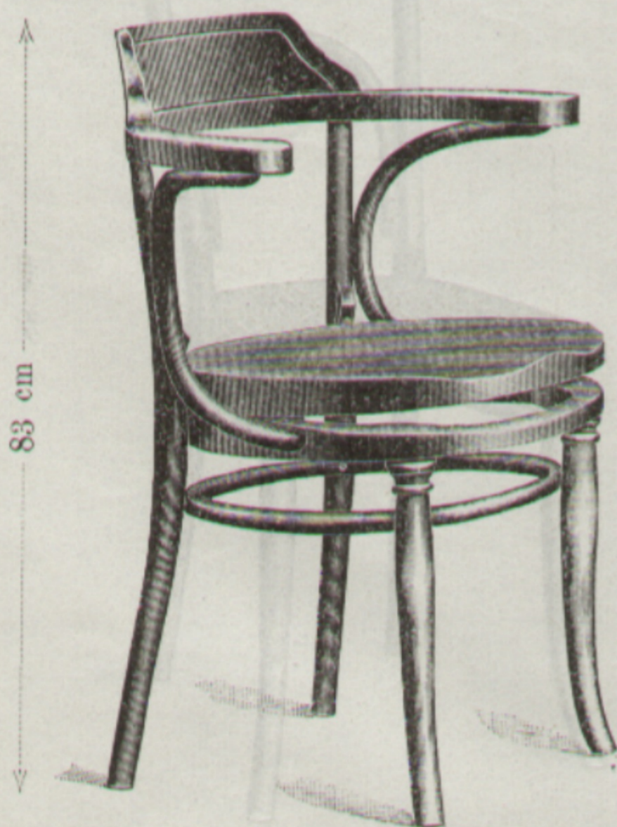
Nr. 6135 { Schreibtischfauteuil Fauteuil de bureau (D) 44 x 46 cm

Erzeugende Fabrik: } Fabriqués par } Bystritz.