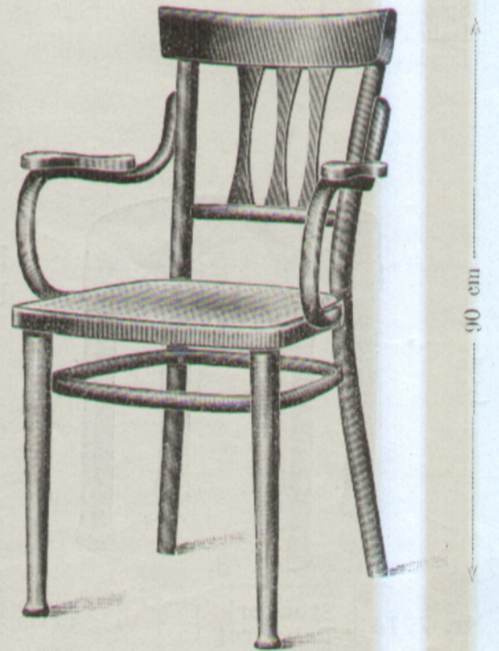
Nr. 1619 { Fauteuil 44 × 44 cm