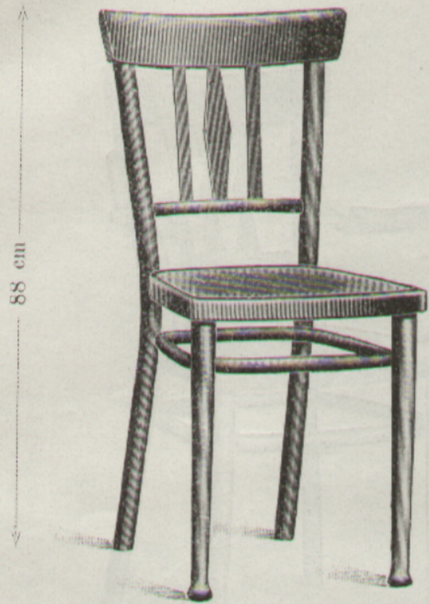
Nr. 618 { Sessel Chaise 41 × 40 cm

Erzeugende Fabrik: Fabriquée par Wsetin.