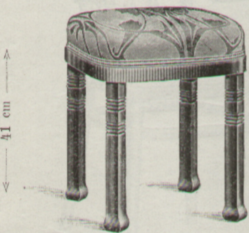
Nr. 7914 { Stockerl Tabouret 40 × 40 cm Paßt zur Garnitur } Nr. 7514 Allant au mobilier }

Erzeugende Fabrik { Fabriqués par Bystritz.