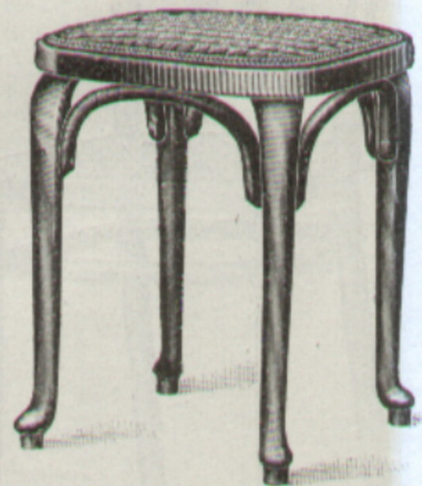
Paßt zur Garnitur } Nr. 461- Allant au mobilier } 492 Nr. 4779d { Stockerl Tabouret 37 × 37 cm