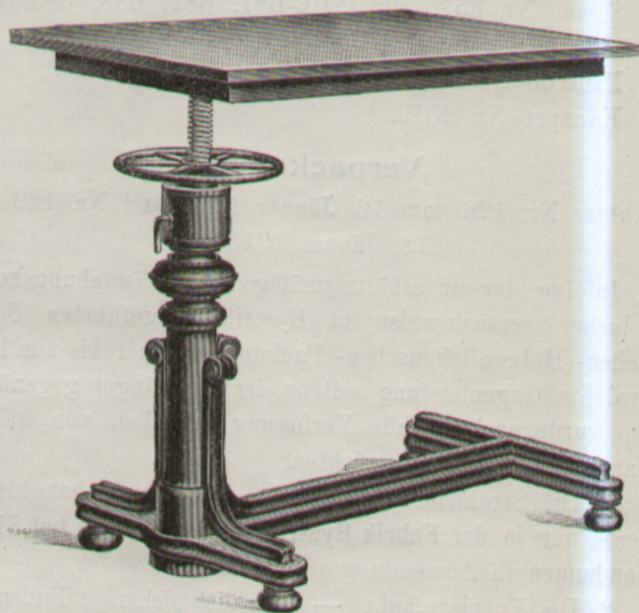
Neue Normalausführung. — Nouvelle façon normale.

Par le fait de porter la petite traverse à l'extrémité de la grande traverse, la table a gagné aussi en fait de stabilité.