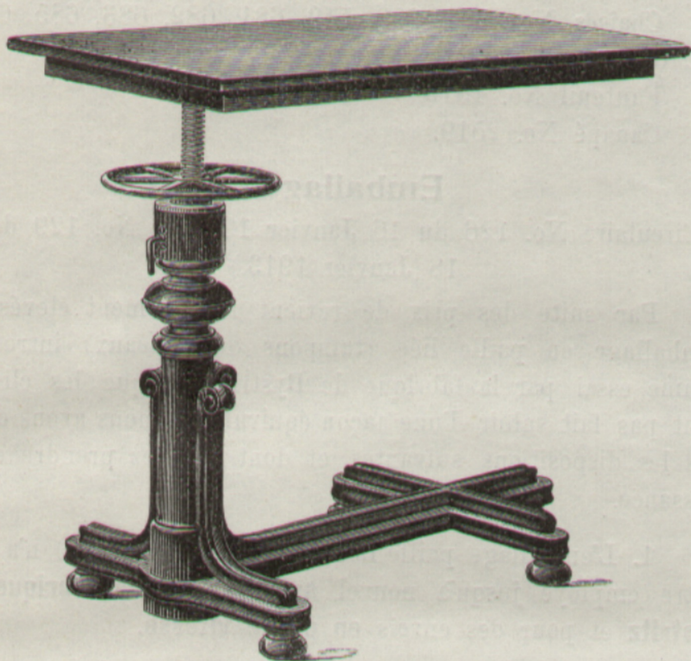
Frühere Ausführung. — Ancienne façon.

Durch das Hinausrücken des Querbalkens an das Ende des langen Balkens hat der Tisch obendrein an Stabilität gewonnen.