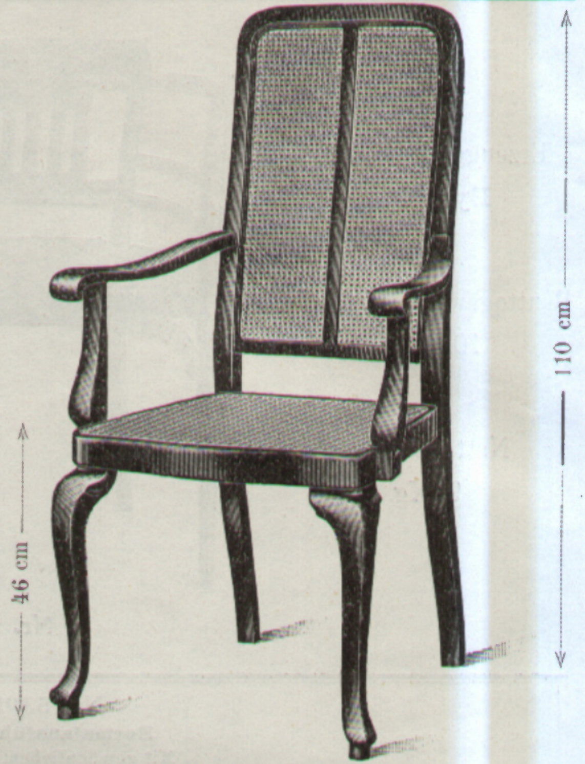
Nr. 1513, Fauteuil 49 x 50 cm