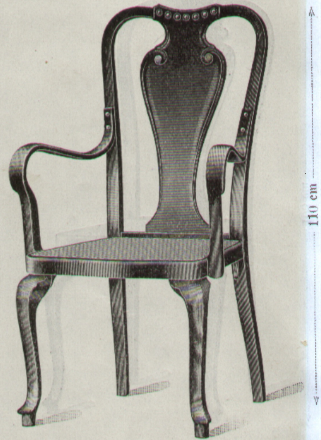
Nr. 1745, Fauteuil 49×50 cm