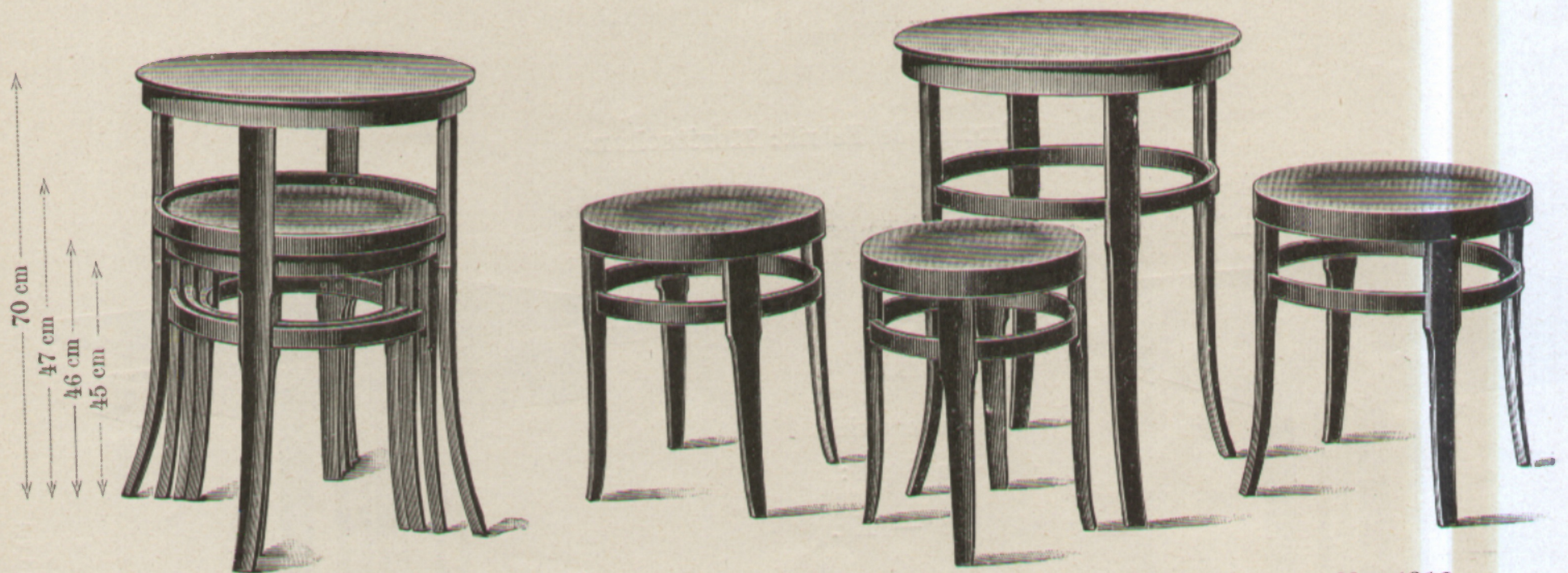
Stockerlmagazin Nr. 4815 K 40.—