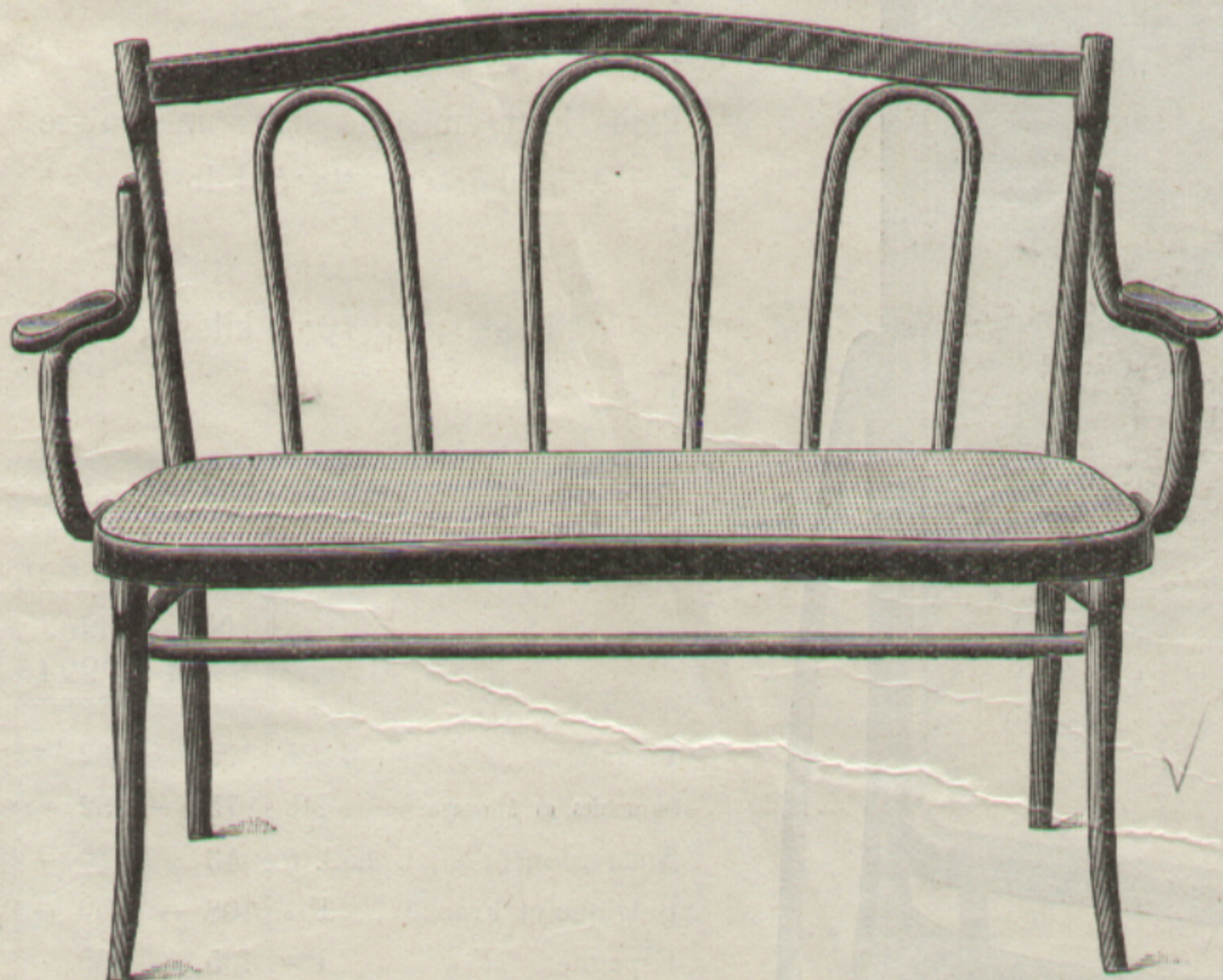
Nr. 105 { Kanapee } { 111 Cm. Nr. 2105 } { Canapé } { 135 Cm. Nr. 3105 }

Bruttogewicht in Stroh 6.5 Kg. Poids brut emballé en paille 6.5 kilos. Nettogewicht 5.4 Kg. Poids net 5.4 kilos.