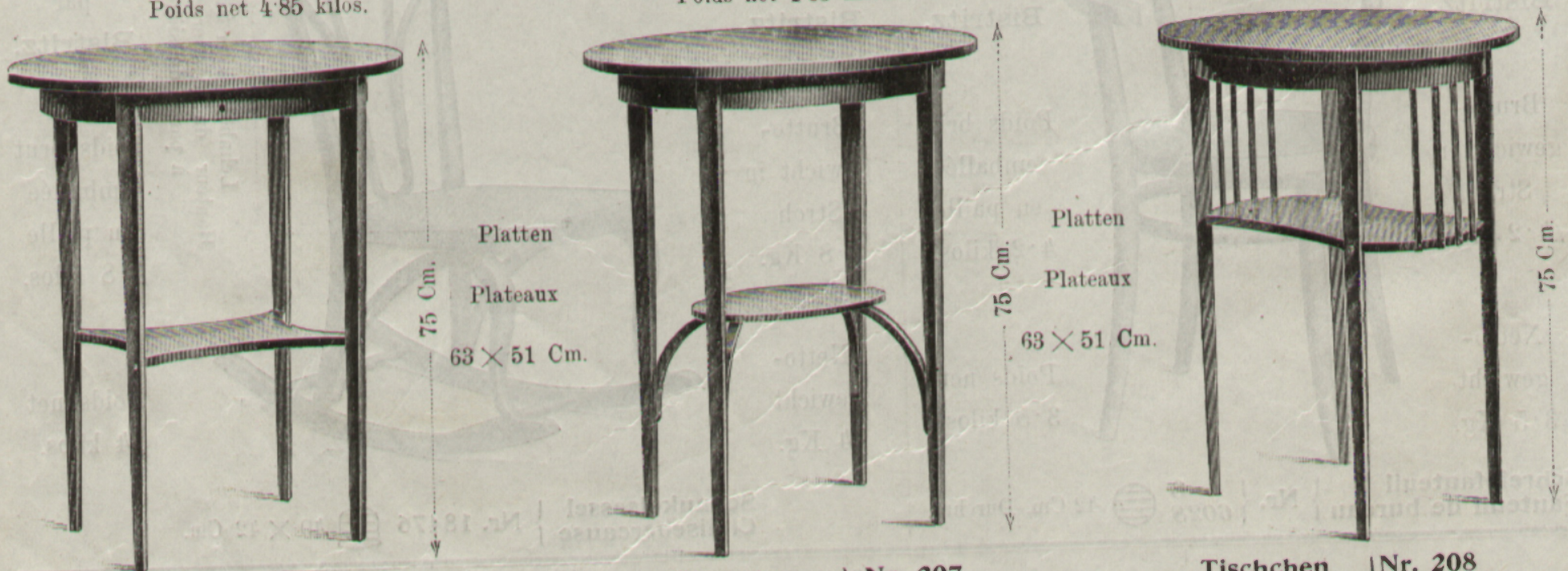
Tischchen } Nr. 206 Tischchen } Nr. 207 Tischchen } Nr. 208 Petite table } 9206 Petite table } 9207 Petite table } 9208

Bruttogewicht in Lattenkiste 13 Kg. Bruttogewicht in Lattenkiste 13 Kg. Bruttogewicht in Lattenkiste 14 Kg. Poids brut, emballée en caisse a clair-voir 13 kilos. Poids brut, emballée en caisse a clair-voir 13 kilos. Poids brut, emballée en caisse a clair-voir 14 kilos. Nettogewicht 4'85 Kg. Nettogewicht 4'85 Kg. Nettogewicht 5'40 Kg. Poids net 4'85 kilos. Poids net 4'85 kilos. Poids net 5'40 kilos.