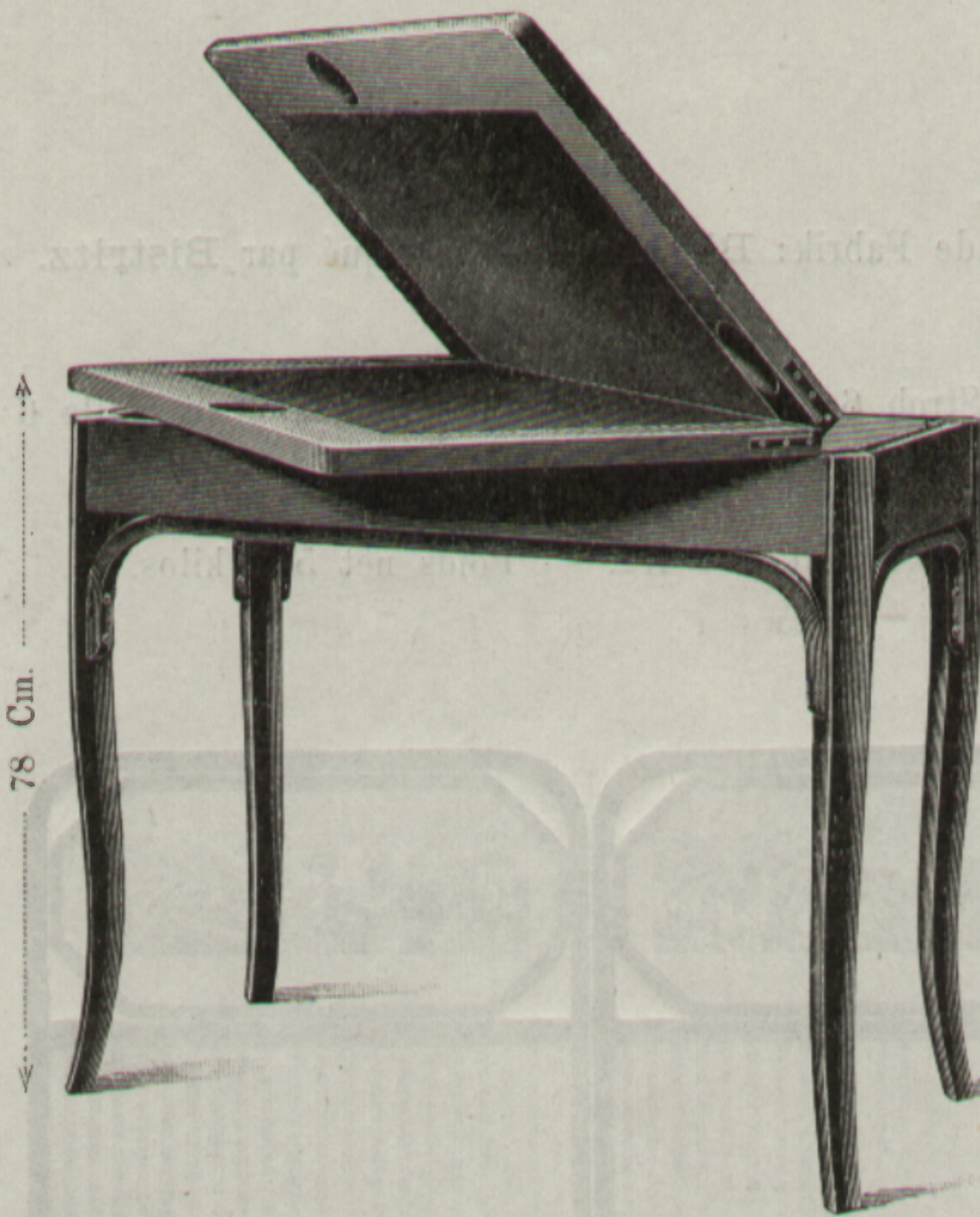
Spieltisch } Nr. { 33 Table à jeu } 9333