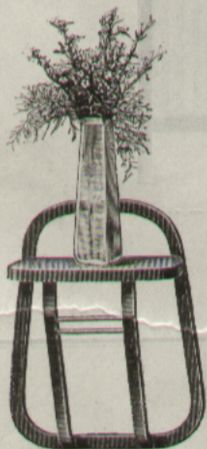
Hänge-Etagère Etagère de paroi Nr. { 59 11559