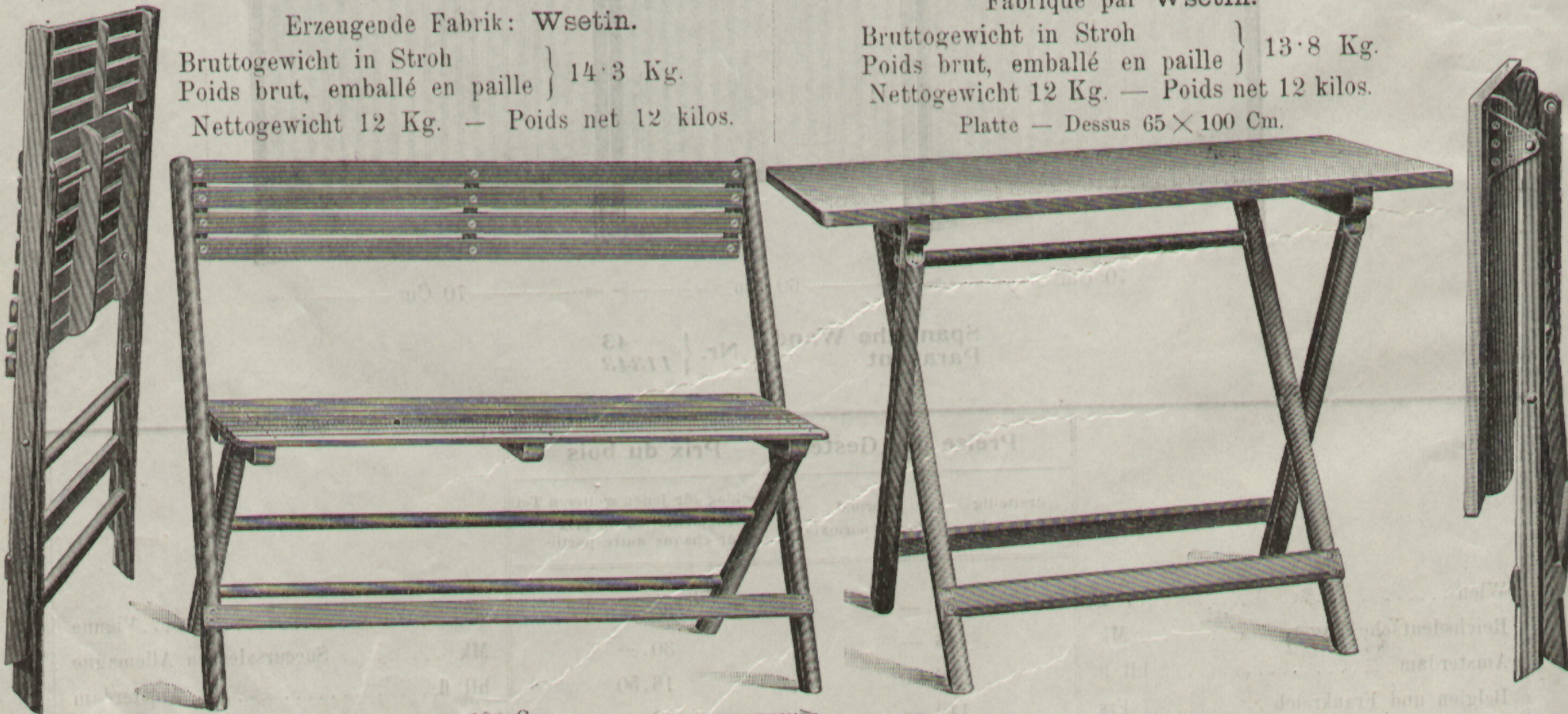
Gartenklappbank Nr. 13. — Banc pliant de jardin No. 13. | Gartenklapptisch Nr. 13. — Table pliante de jardin No. 13.

Bruttogewicht in Stroh } Poids brut, emballé en paille } 13·8 Kg. Nettogewicht 12 Kg. — Poids net 12 kilos. Platte — Dessus 65 × 100 Cm.